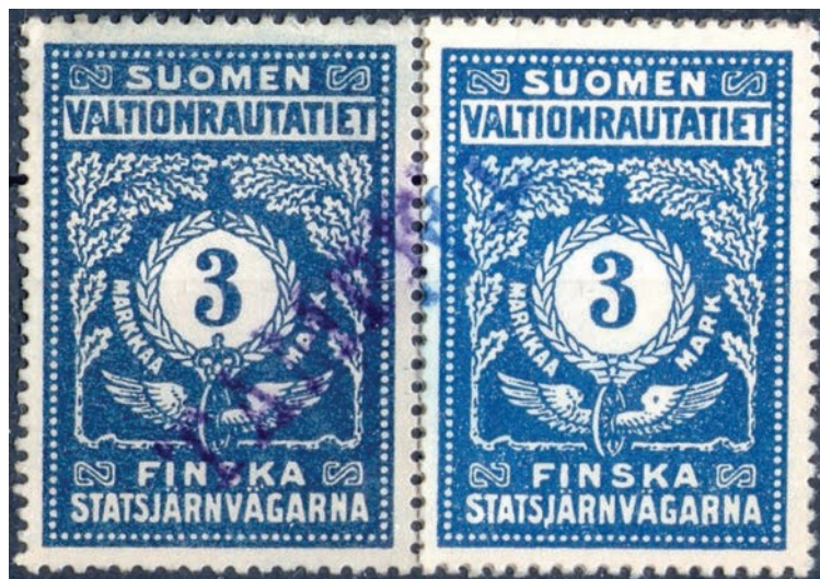
x. Pyöreä laikka sanan VALTIONRAUTATIET ensimmäisessä A kirjaimessa, vasemmalla 1917 kruunulla ja oikealla 1918 ilman kruunua.