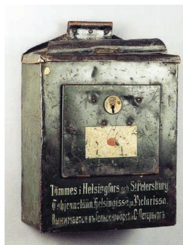
Helsinki-Pietari rataosan postivaunun kirjelaatikko, joka tyhjennettiin sekä Helsingissä että Pietarissa.

Kaupunginpostin kirjelaatikat olivat helakanpunaisia erotukseksi postilaitoksen kirjelaatikoista. Kirjeenkantajina toimi nuoria poikia, jotka kantoivat olallaan nelihakaisia tankoja, joihin kirjelaatikoiden sisäkotelot kiinnitettiin. Sisäkotelot avattiin vasta postikonttorissa. Aluksi kirjelaatikoita