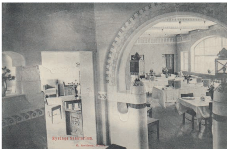
Rakennuksen sisältä löytyy entisiä huonetiloja sekä koristeellisia maalausornameutteja, jotka entisöitiin osittain vuonna 1984. Kortti postitettu 30.VI.06 Imatralle Ingengören R. Schaumanille.