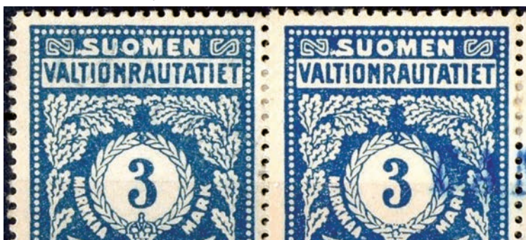
Valkoinen täplä SUOMEN-sanan S-kirjaimen edessä, vasemmalla 1917 kruunulla ja oikealla 1918 ilman kruunua.

muun virheen joukosta, joista alan kirjoissa ei ole mainintaa.