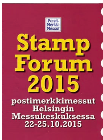
StampForum-näyttelyn luettelon kansiviime vuodelta.

Kevään aikana kerhoilloissa kerätään tietoa halukkaiden kokoelmista.