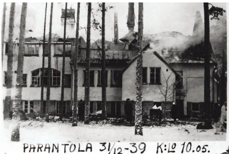
Kivilinna vaurioitui pahoin ja vuoden 1917 laajennusosa tuhoutui täysin talvisodan pommituksissa 31. joulukuuta 1939.