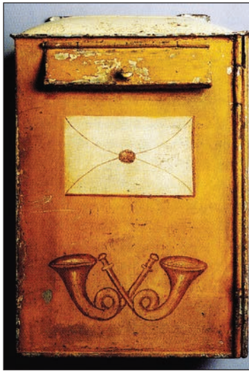
Keltainen "Postitorvilaatikko" 1800- ja 1900-lukujen vaihteesta.

sisältyi määräys, jonka mukaan kirjelaatikoita oli postihallituksen toimesta asetettava paitsi kaikkiin postitoimipaikkoihin myös rautatieasemille ja muihin soveliaisiin kohtiin kaupungeissa. Laatikoihin oli lupa panna vain tavallisia lähetyksiä. Laatikot oli tyhjennettävä vähän ennen postin lähtöhetkeä. Vuodesta 1871 lähtien kaikkiin kirjelaatikoihin oltiin voitu jättää myös Venäjälle meneviä kirjeitä.