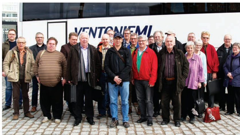
POHJOISMAINEN NORDIA 2016 JYVÄSKYLÄSSÄ