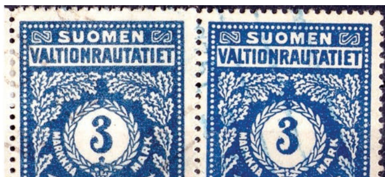
z. Epämuodostunut arvomerkin ”3”, vasemmalla 1917 kruunulla ja oikealla 1918 ilman kruunua.