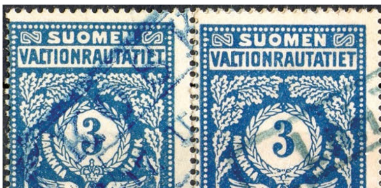
Sininen täplä yhdistää kirjaimet L ja T sanassa VALTIONRAUTATIIET, vasemmalla 1917 kruunulla ja oikealla 1918 ilman kruunua.