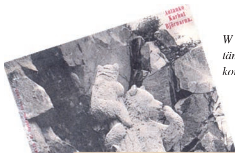
W Sandelinille tuli paljon postia mm. tämä Tavastehusista 7.XII.03 lähetetty kortti.