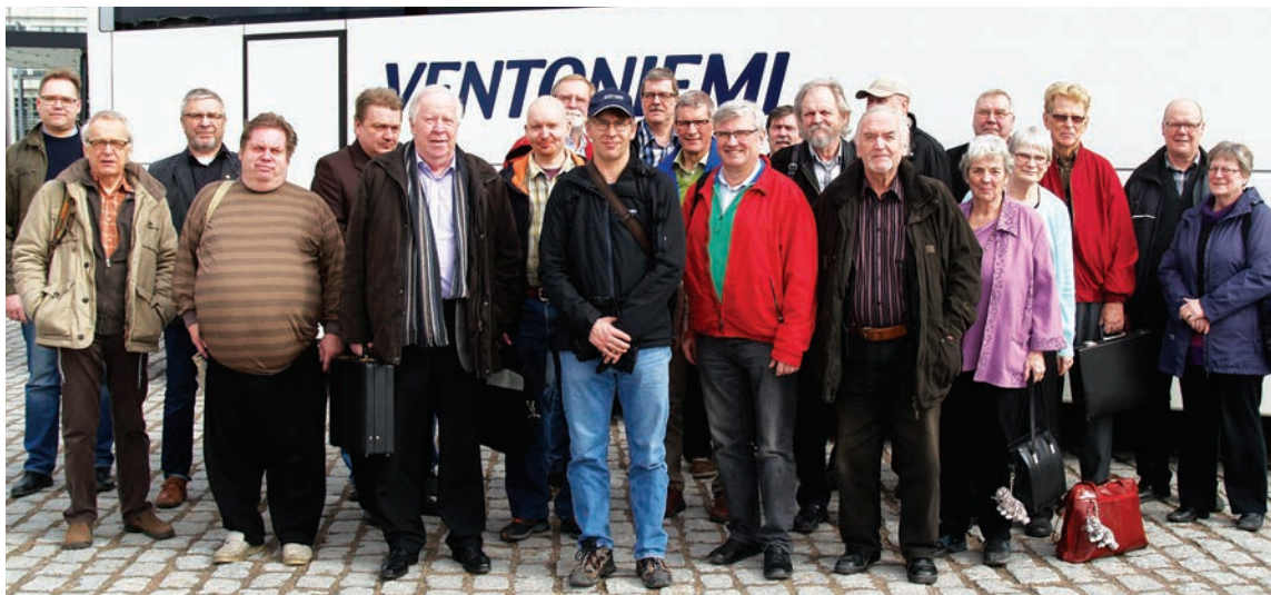
Tavastforum-kerhojen yhteiskuljetuksessa näyttelyyn osallistuneita.