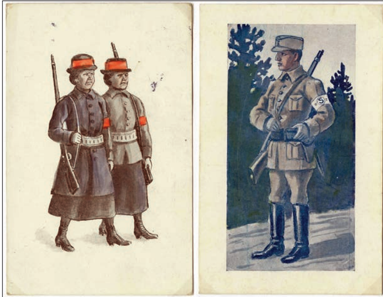
Sotien osapuolien tunnuksivat 1918 sisällissodassa minimissään valkoinen ja punainen käsivarsinauha. Suojeluskuntalaista kuvaava melko harvinainen kortti on ilmeisesti tehty maalauksesta, naispunakaartilaisia kuvaava piirretty kortti on hyvin harvinainen. Viime mainittu on lähetetty Suomesta Ruotsiin marraskuussa 1918.

tehtävä syöttää toiseen koneeseen 10-pennisiä ja Kari itse otti haltuunsa toisen automaatin.