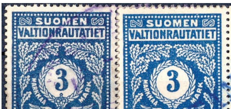
y. Valkoinen läikkä saman A-kirjaimen yläosassa, vasemmalla 1917 kruunulla ja oikealla 1918 ilman kruunua.