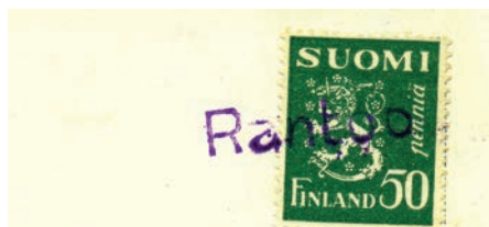
Rantoo (violetti tai musta): perustettu 1.2.1928 postipysäkiksi, lakkautettu 1.11.1972. Käyttöaika: 24.11.1930–21.12.1961 (7 kpl).