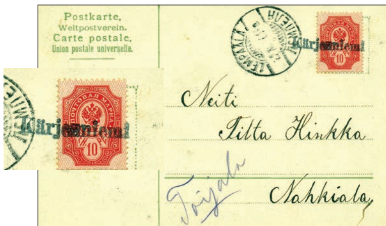
Kärjenniemi (ohuet kirjaimet): Käyttöaika: 20.12.1907.–10.11.1924 (14 kpl).