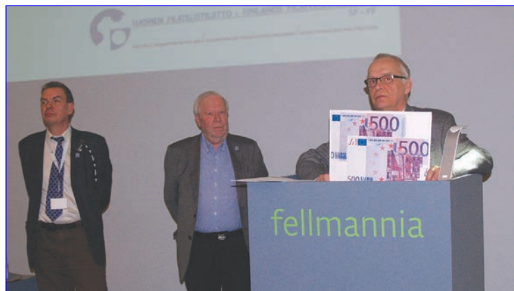
HÄMEENLINNAN POSTIMERKKIKERHO VUODEN KERHO

FORSSAN, HYVINKÄÄN, HÄMEENLINNAN, JANAKKALAN, RIIHIMÄEN, TOIJALAN JA VALKEAKOSKEN POSTIMERKKIKERHOJEN TIEDOTUSLEHTI 2/2015, NRO 14