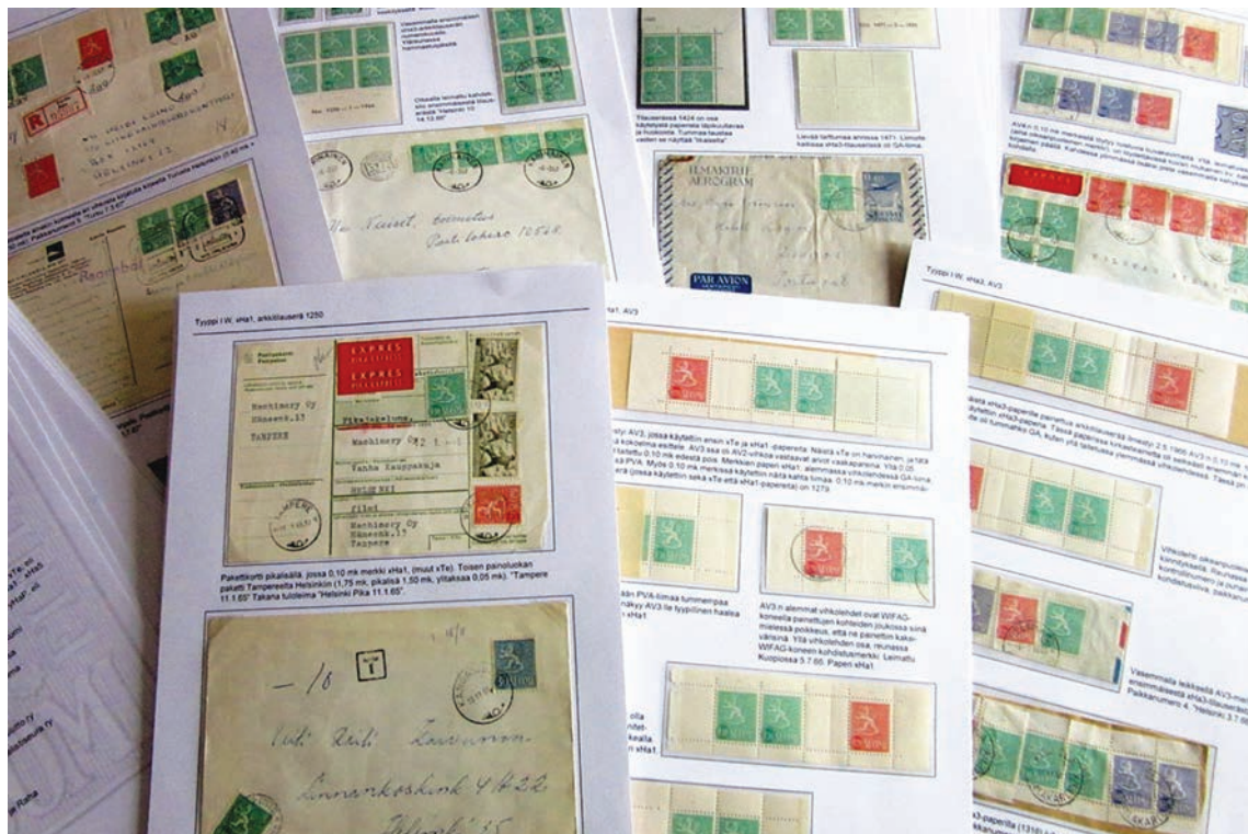
Käyttösarjan 1963 keräily kapea-alaistui entisestään ja mielenkiintoni kohdistui pelkästään 10 pennin vihreään leijonamerkkiin. Siinä oli kuitenkin koko käyttösarja tyyppineen ja papereineen kompaktissa paketissa.

vihkonomaiseen Koko Maailma -postimerkkikansioon. Postituoreita ei tarvinnut liimata, nuolaisu riitti. Muistini mukaan ainakin romanialaisissa merkeissä oli hyvin pahanmakuinen liima.