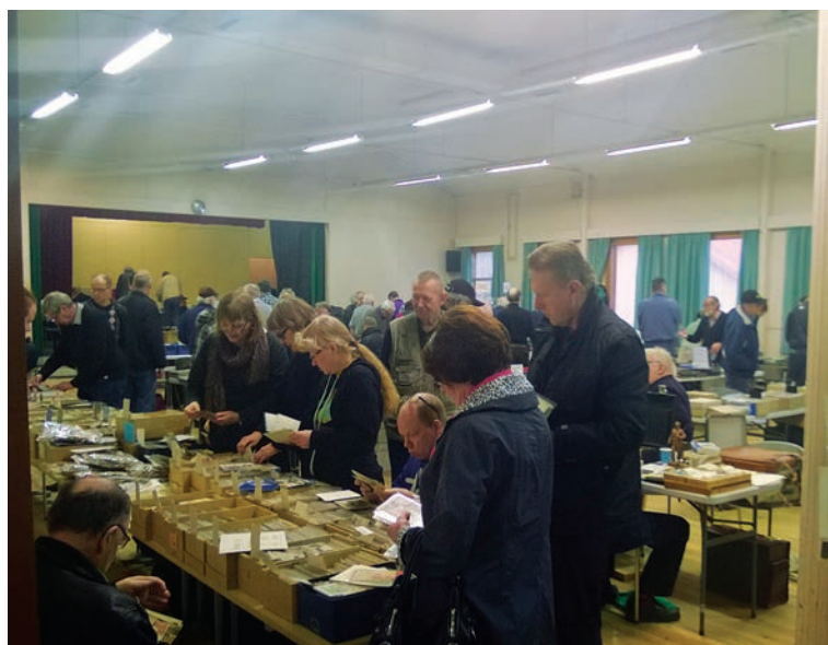
Sali hieman ennen virallista avausta, väkeä jo mukavasti.

Tapahtuma taitaa olla hyvinkin suosittu, kun talkooporukka on kohdannut ensimmäiset myyjät jo pitkäperjantaina odottelemassa ovien aukeamista. Samoin itse lauantaina tupa on täynnä jo ennen kello yhdeksää, jolloin virallisesti pitäisi aloitella. Tämän vuoden tapahtuma sujui kaikilta osa-alueilta erinomaisesti, siitä suuret kiitokset talkooväelle. Erityiskiitos keittiön hengettärille jotka jaksoivat vääntää tuoreita voileipiä ja pitää pannun kuumana. JK