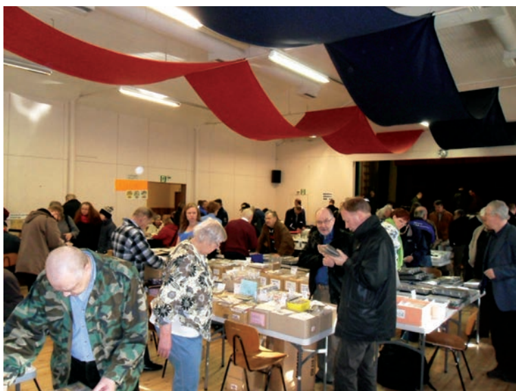
Vaihtopäivillä 2012 jälleen kerran mukavan ahdasta.