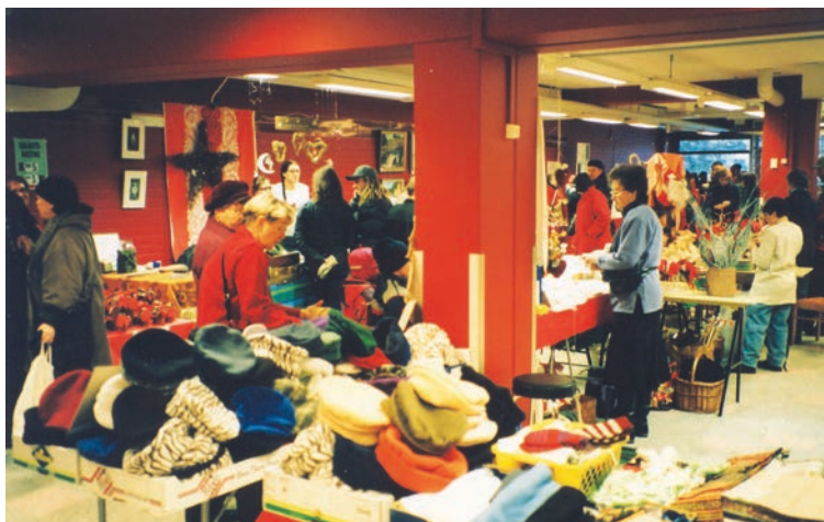
Joulumyyjäiset entisen Alkon myymälässä 2006. Myyjäisissä ainoat postaaliset kohteet löytyivät kerhon pöydästä. Tarjolla oli kerhon julkaisemia kortteja ja omakuvamerkkejä.

jolloin sadetta on jouduttu pidättele- mään sisätiloissa. Ennen kerhon omaa tilaa myös syyskauden ensimmäinen kokoontuminen oli samaisessa paikas- sa Tammelassa.