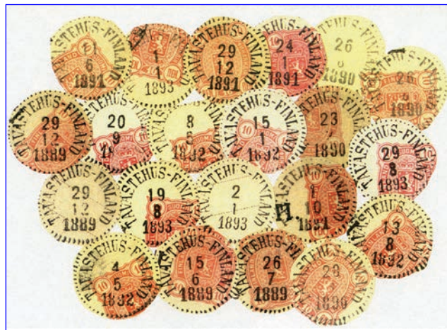
AIKANSÄ ERIKOISUUS, PISTERENGASLEIMA