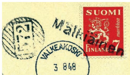
Mäkiäinen (musta): perustettu 1.4.1928 postipysäkiksi, lakkautettu 1.9.1959. Käyttöaika: 26.4.1928–17.6.1959 (28 kpl).