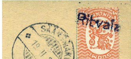
Ritvala (musta): perustettu 1.1.1929 postipysäkiksi, 1.2.1932 postiasema II ja 1.10.1966 postiasema I. Käyttöaika: 2.3.1929–23.12.1931 (10 kpl).