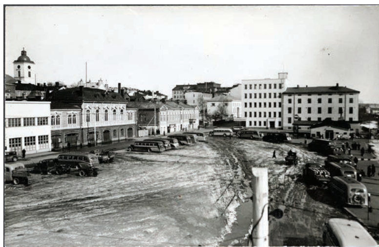
POSTIKORTIN KUVAPUOLI KERTOO PALJON