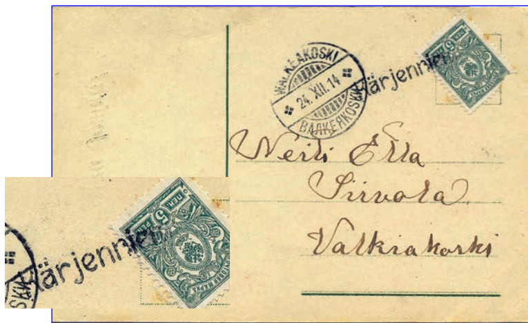
Kärjenniemi (paksut kirjaimet): perustettu 1.2.1900 postipysäkkiksi, 1.5.1927 postiasema II ja 1.3.1959 postiasema I. Käyttöaika: 2.9.1906 (4 kpl).

Toivon, että tämä pieni juttu postipysäkkileimoista saisi jatkoa muiden yhdistysten taholta ja saataisiin nämä leimat kartoitettua omalta alueeltamme.