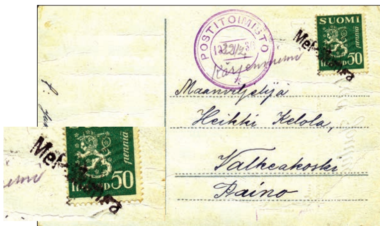
Metsäkansa (musta): perustettu 1.6.1928 postipysäkkiksi, 1.3.1947 postiasema II ja 1.6.1955 postiasema I. Käyttöaika: 22.12.1930 – 1.2.1947 (41 kpl).