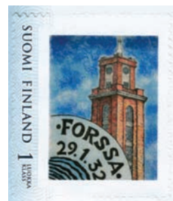
ESITTELYSSÄ FORSSAN FILATELISTIKERHO