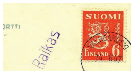
Raikas (violetti): perustettu 1.1.1943 postipysäkiksi, 1.11.1962 postiasema I ja 1.7.1971 Valkeakoski 8. Käyttöaika: 3.4.1943–14.8.1947 (7 kpl).