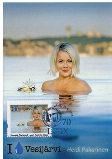
Lahden Postimerkkikerhon näyttelykortti ja omakuvamerkki liittyi tälläkin kertaa Vesijärven suojeleluun.